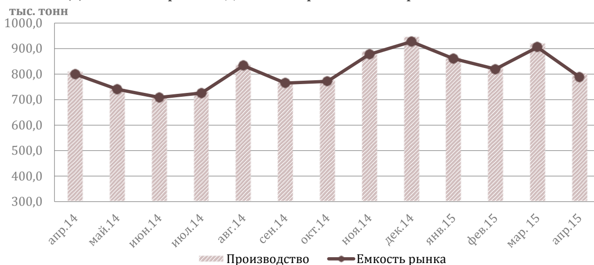
Рисунок 1 Динамика производства-потребления серной кислоты в РФ – 2014-2015 гг., тыс. тонн.

Снижение производства серной кислоты наблюдалось почти на всех крупнейших предприятиях. На предприятии «Минудобрения (Воскресенск)» зафиксировано наращивание производства относительно марта XXXX года на XX%. Рост производства ожидается в XXXX г., т.к. планируется ввод в эксплуатацию реконструированного сернокислотного производства мощностью XXX тыс. т/год на «Карабашском медеплавильном заводе».