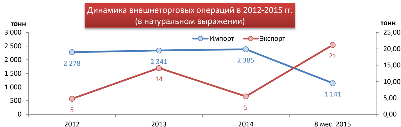
Рисунок 1 Динамика внешнеторговых операций ( в натуральном выражении) в 2012- 2015 гг.

Объем внешнеторговых операций по анализируемым кодам ТН ВЭД РФ по итогам 8 мес. 2015 г. составил 1,16 тыс. тонн (-27% к АППГ) на общую сумму $14,7 млн. (-33%). С 2012 года динамика внешнеторговых операций разнонаправленна (рис. 1.), в 2013 году, объем экспорта вырос на 3%, в 2014 – на 1%, при этом объем импорта растет стабильно медленно, а экспорт в 2013 году вырос в 2 раза, относительно 2012 года, в 2014 году – снизился на 61% (Таблица 1).