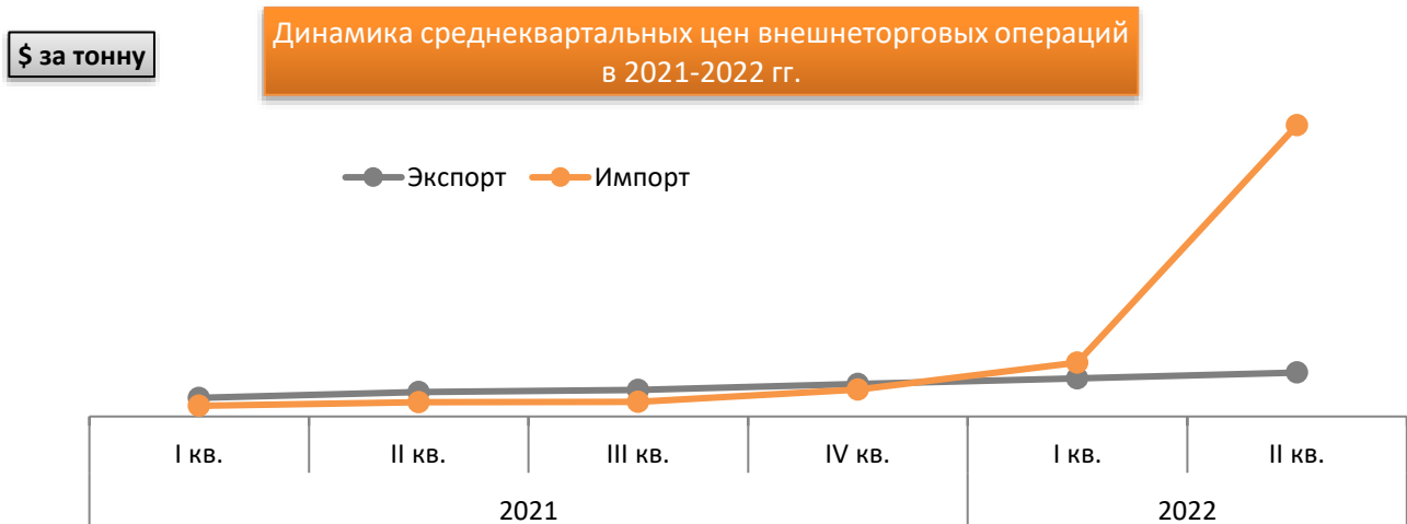
Рисунок 3 Динамика среднеквартальных цен внешнеторговых операций в 2021 – 2022 гг.

Средняя стоимость тонны экспортной дроби по итогам 1 плг. 2022 г. выросла относительно аналогичного периода 2021 г. на 55%, средняя цена импорта выросла в 3 раза. Рост цен наблюдался весь прошлый год, но был достаточно планомерным, в первом же квартале текущего года, и особенно во втором, наблюдался резкий скачок, что объясняется отсутствием поставок дешевой украинской дроби (Таблица 4).